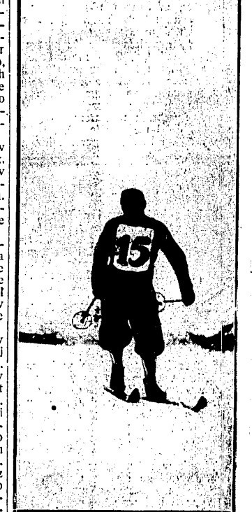
KOLTERUD (NORWEGIA), jeden z czołowych zawodników, w kombinacji narciarskiej.