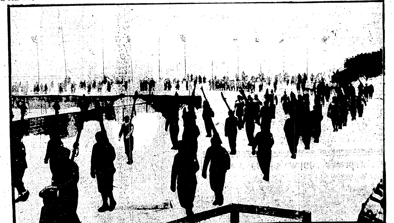
POD ROZWIĘTYMI SZTANDARAMI Inauguracyjna defilada olimpijczyków, wśród których wspaniale wykwapowana i pełna swobodnego wyrazu drużyna polska zwracała uwagę wszystkich