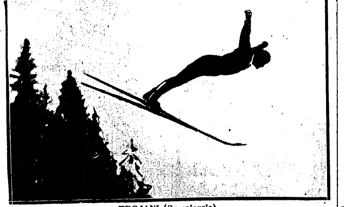
TROJANI (Szwajcaria) ma skoczn Bernina w Pontresinie osiągnął 71 mtr., dowodząc tem, że skoczn Norwegowie nie będą w w St. Moritz bezkonkurencyjni