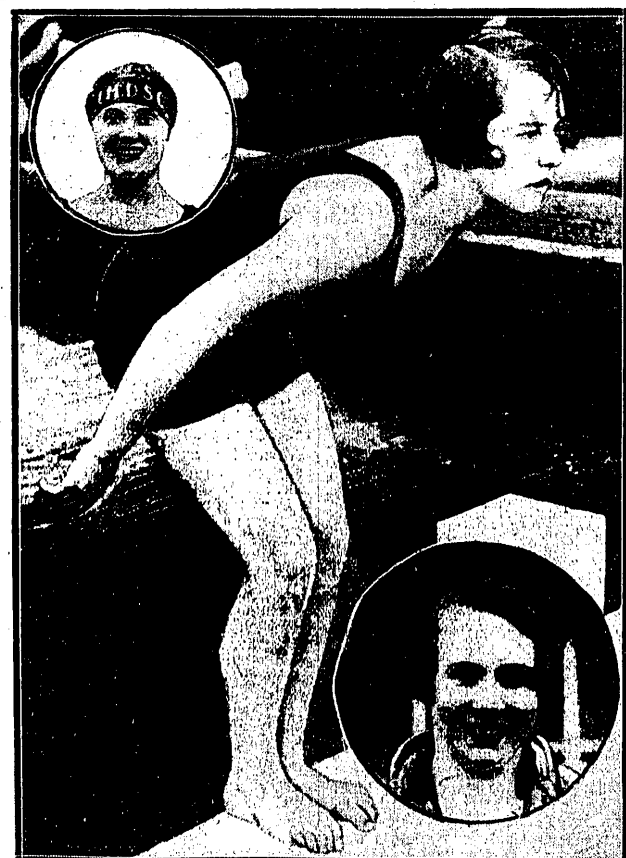
REKORDZISTKI PŁYWACTWA ŚWIATOWEGO