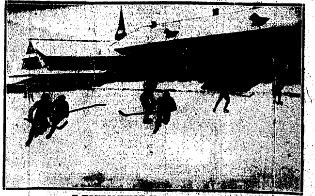
Z HOKEJOWYCH MISTRZOSTW POLSKI Moment z meczu Ż. K. S. — Pogon 1:1, który zdecydował o zdobyciu przez...