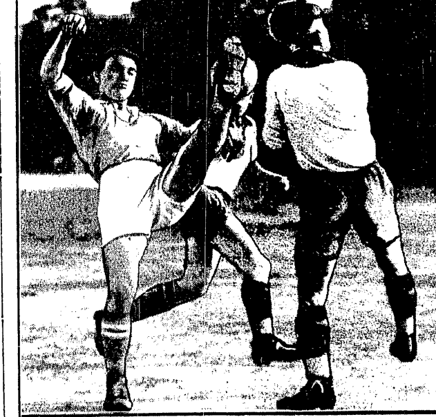
ZWYCIĘSTWO POLICJI POLSKIEJ NAD GDANSKĄ Interesujący moment z meczu policji Gdańsk - Polska, uchwyczony przez jednego z naszych czytelników i nadesłany na nasz konkurs fotograficzny.