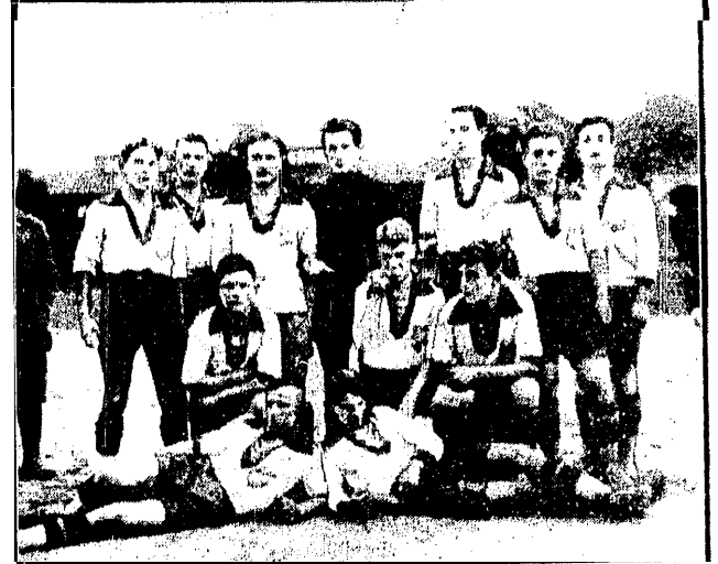
REPREZENTACJA POLICJI POLSKIEJ

bez trudu uporała się z reprezentacją policji gdańskiej, zwyciężając w stos. 7:2