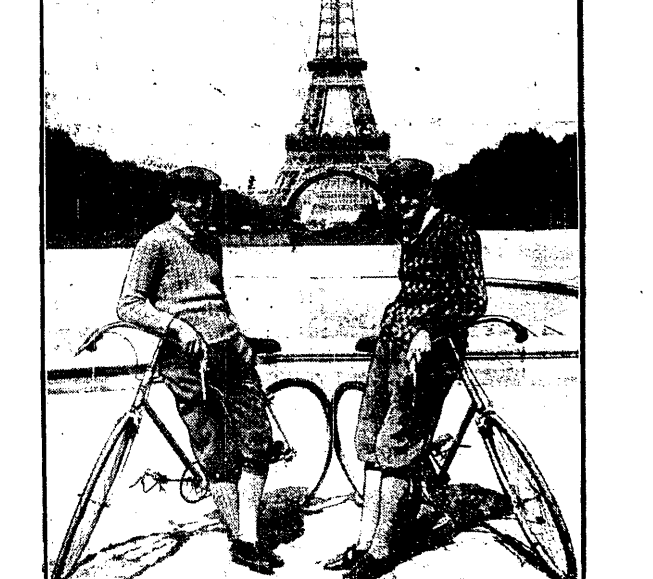
KOLARZE POLSCY POD WIEŻĄ EIFFLA Barzycki i Michalak, dwaj kolarze krakowscy, bawią w Paryżu, gdzie trenują usiłnie pod okiem fachowców