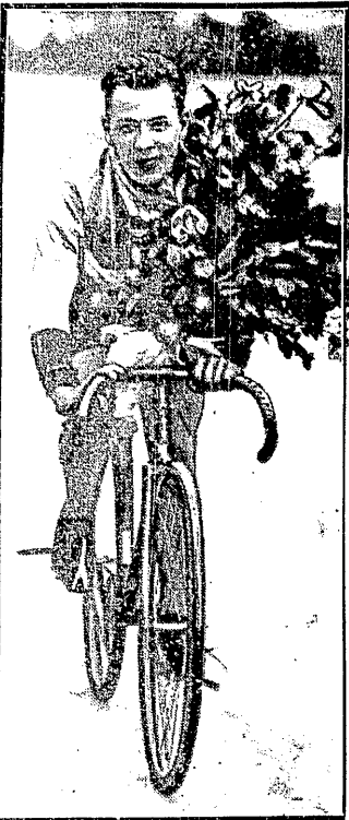
MICHARD fenomenalny sprinter francuski zdobył tytuł torowego mistrza świata