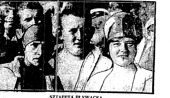
SZTAFETA PŁYWACKA Toruńskiego Klubu Sportowego wzięła podczas regat Bydgoszczy panu Prezydentowi sztafetę z Torunia