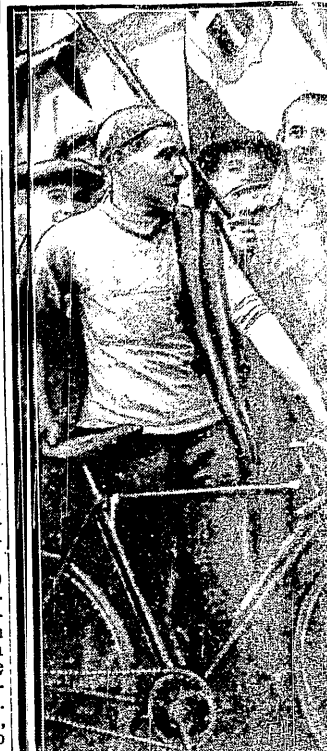
BINDA zwyciężył w mistrzostwie szosowym świata w Kolonii