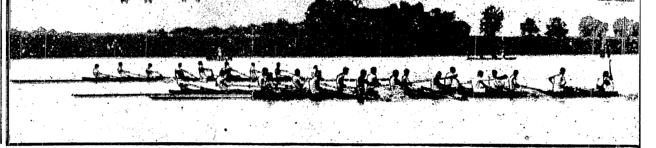
POWITANIE P. PREZYDENTA PODCZAS REGAT W chwili, gdy p. Prezydent Rzplitej, Mościcki, zajął miejsce w łożu honorowej, ukazało się na horyzoncie osiem samolotów, które okrążyły trybuny, oddając hołd najwyższemu dostojnikowi w państwie