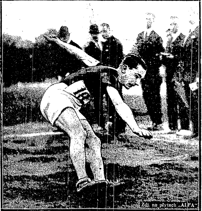
Zdł. na płytach „ALFA”