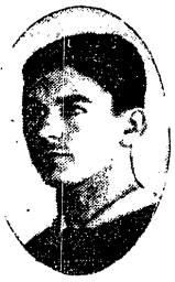
SPOJDA (WARTA) odznaczył się na meczu z Ł.K.S-em w Poznaniu

Tak więc rolę przeglądkowo-hodowlaną spełniły konkursy w zupełności.