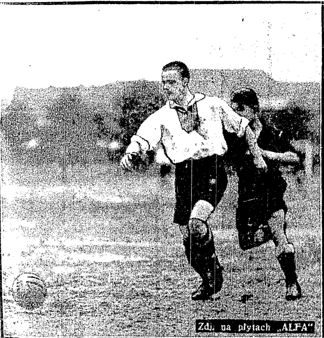
Zdł. na płytach „ALFA”