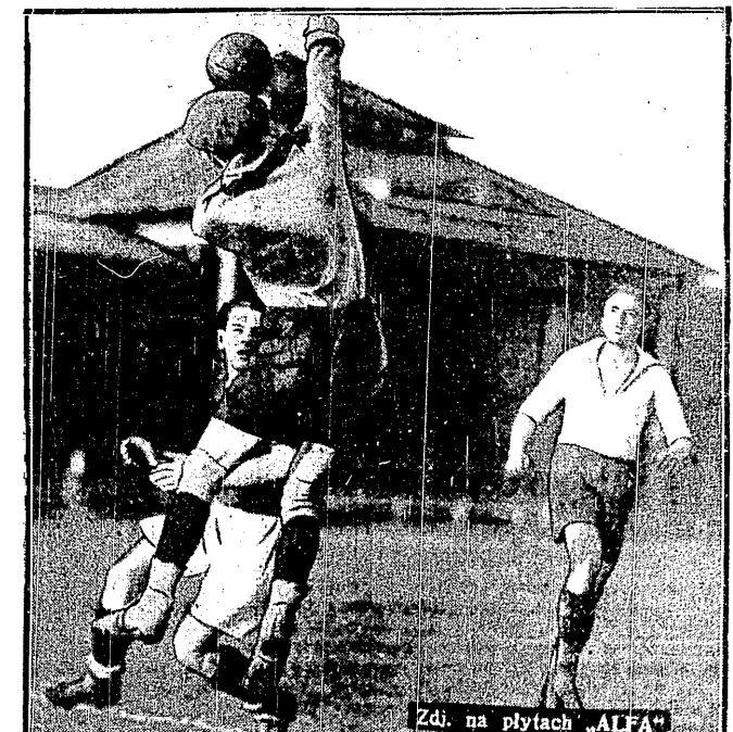
Zdł. na płytach „ALFA”

LEGJA — CZARNI 2:0 Obrona wojskowych z łatwością likwidowała dość anemiczne akcje napadu lwowian