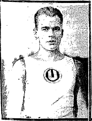
JEKALS (Łotwa) Jeden z najszechstronniejszych atletów baltickich przybywa do Warszawy na trójmecz balticki

Cechami charakterystycznymi mistrzostw ubiegłych były: naogół wysoki poziom wyników, specjalnie dobra forma kilku zawodników, oraz — co jest niezmiernie naszą lekką atletyką — brak wszelkich walorów widowiskowych. Wzory francuskie, niemieckie czy angielskie ucza nas, że strone sportowa może połączyć z walorami widowiskowymi doskonale; trzeba tylko tego chcieć, umiejętnie zapłacić tryby poszczególnych konkurencji i wyłutować pp. siedmio i zawodnikom, że żaden z nich nie może się ani jednej sekundy znajdować na boisku jako najzwyklejszy tam zbyteczny widz. Najbardziej życzeń poszły, jak zwykle, przedbiegi na 100 i 400 mtr. Zawodnicy nie fatygowali się w nich zbyt