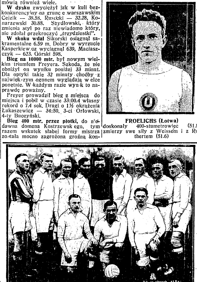
RUCH (Wielki Hajduk) zatriumfował niespodziewanie nad Polonią warszawską, odnosząc po pięknej grze bezsporne zwycięstwo