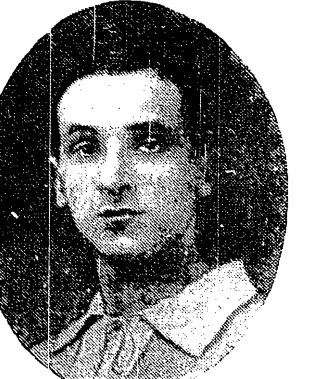
BERSZ (Turyści — Łódź) na meczu z Polonią wykazał swe nie zwykle walory kierownika napadu i zdobył jedyną bramkę dla łodzian

Z graczy Warszawianki wyróżnił się Zwierz II w pomocy piękna gra, Luxemburg bawił widzów humorem.