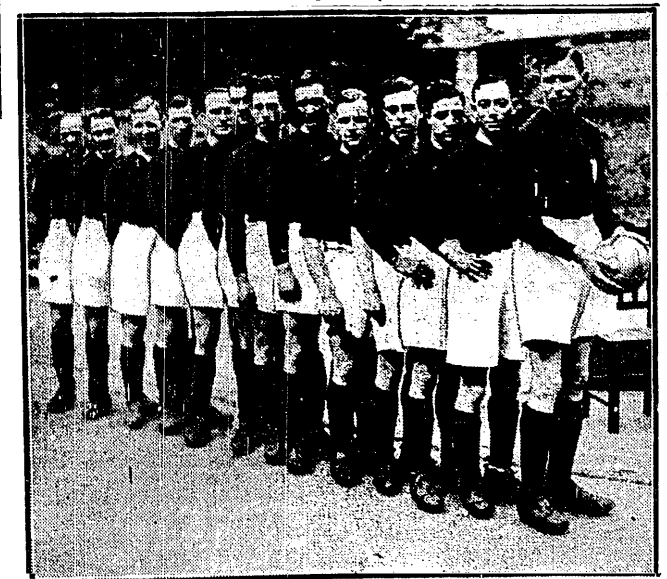
CARDIFF CITY wobec 90.000 widzów pokonał w finale o puchar Arsenai (Londyn) w stosunku 1:0 i zdobył po raz pierwszy zaszczytną nagrodę