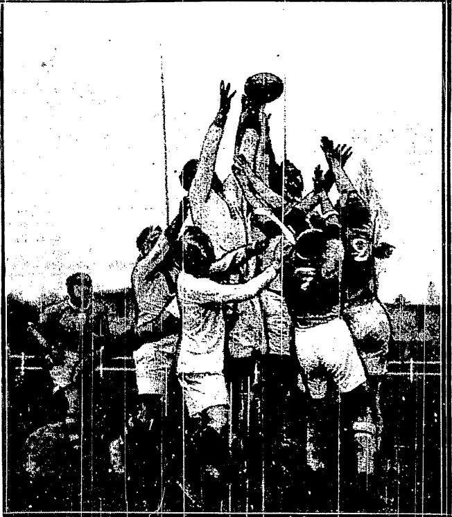
KTO PIERWSZY DOSIĘGNIĘ! Emocjonujący moment z meczu rugby między drużynami Niemiec i Francji

G. Z. O. P. N. z K. S. Naprzód Zależe w stosunku 1:2 (1:0), mimo ładnej gry i dobrej gry.