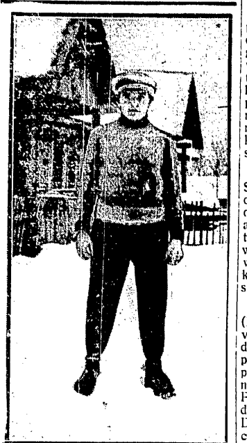
GRACA oblicujący narciarz zakopiański, wyróżnił się jako skoczek na zawodach lwowskich.