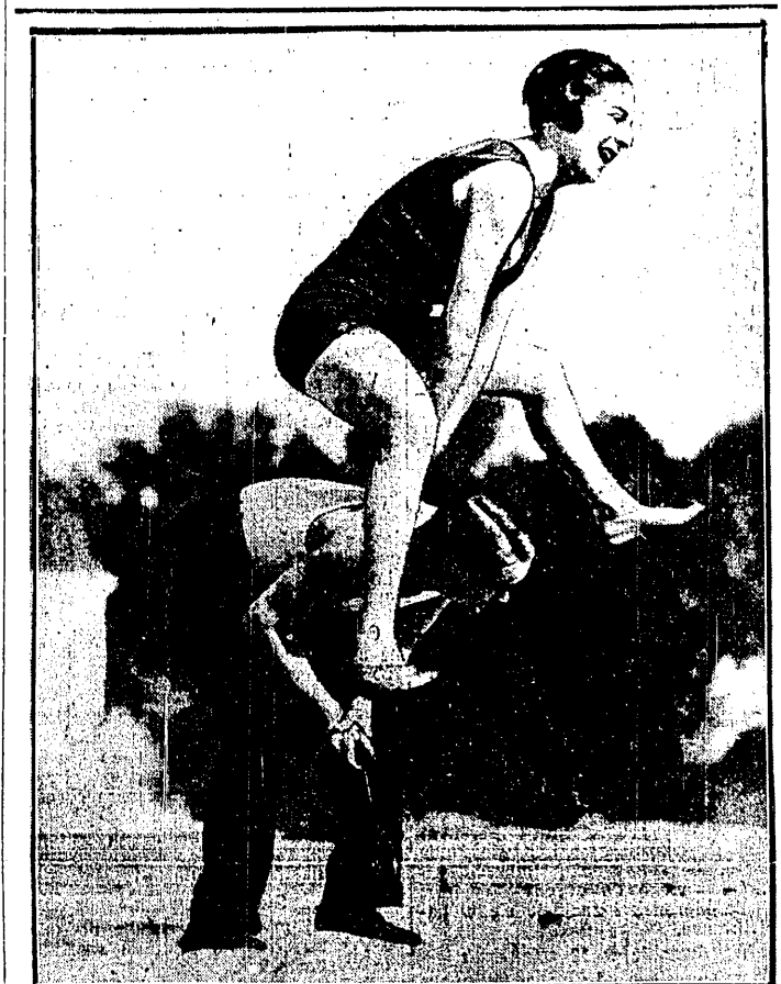
LENGLEN I RICHARDS Oto scena dość osobliwego treningu „boskiej Zuzanny”: zanosząc się śmiechem skacze przez usługowego Richardsa, amerykańskiego mistrza rakiety.

Następnie przechodzi ta płaszczyna w spód, który jest niebardzo stromy i wynosi 90 mtr. przy nachyleniu 36 stopni. Kilkanaście trybun dla sędziów i prasy dopełnia widoku tej skoczni, która dotąd cieszy się opinią najlepszej w Europie. Dziś jest zamknięta z powodu przygotowań do konkursu.