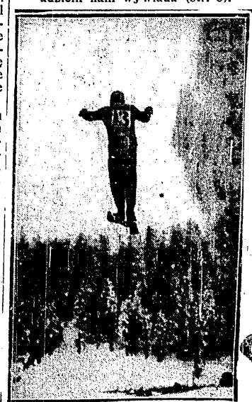
WŁ. ŻYTKOWICZ. reprezentował Polskę na zawodach w Pontresina.