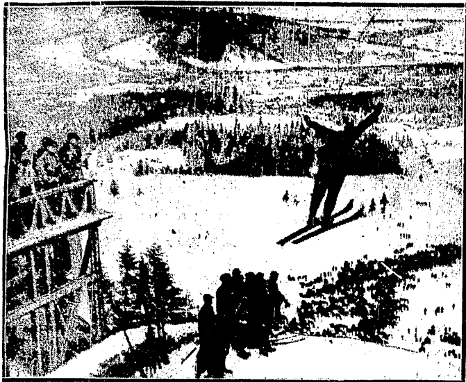
REKORDOWY SKOK NARCIARSKI

Brawo narciarki polskie! Wyniki biegu pań są następujące: