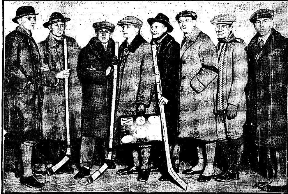
POLSKA REPREZENTACJA HOCKEJA LODOWEGO

Wynik niedzielny A. Z. S-u świadczy, że drużyna jest już dziś w do-