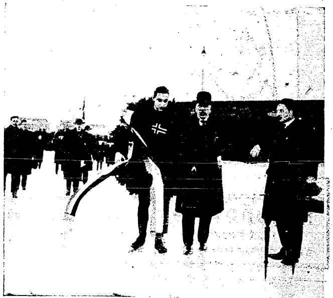
Mistrz świata w jeździe szybkiej na łyżwach, Ballan-grud (Nor.), otrzymuje wieniec laurowy od swego króla.

P. T. C. — Burza 4:1 (0:1). Towarzystwie spotkanie piłkarskie pomiędzy Pabjanickim Towarzystwem Cyklistów i Burzą, przyniosło zwycięstwo pierwszym w stosunku 4:1. Do przerwy wskutek silnego wiatru Burza uzyskuje prowadzenie 1:0. W drugiej połowie gry ten sam sprzymierzeniec (wiatr) wspomaga napad P. T. C., który uzyskuje kolejno cztery bramki.