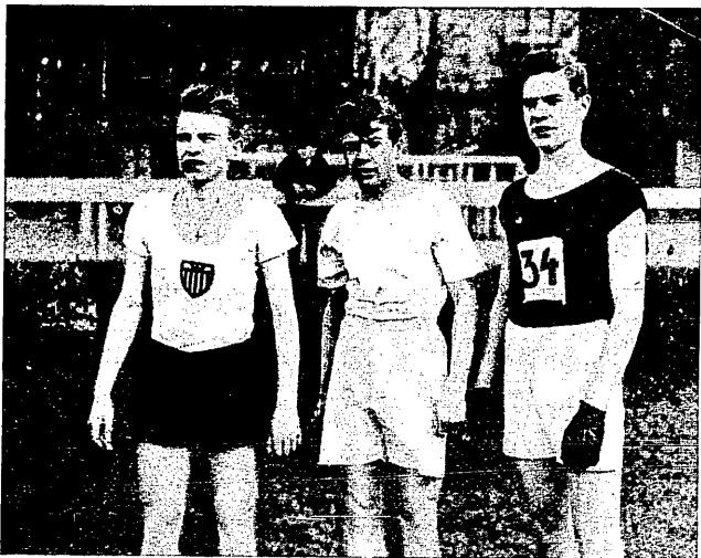
Zwycięzcy w biegu na przełaj dla uczniów szkół średnich w Warszawie.