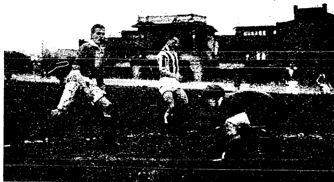
Moment z meczu Legja—Varsovia 2:1

Polonia — Czarni 3:1. Mecz ten, rozegrany w Radomiu, zakończył się nikłym, aczkolwiek pewnym zwycięstwem Polonii. Grę utrudniało zbyt małe boisko. Jedna bramka dla Polonii padła z karnego; dla Czarnych jedyny punkt zdobył Kogut.