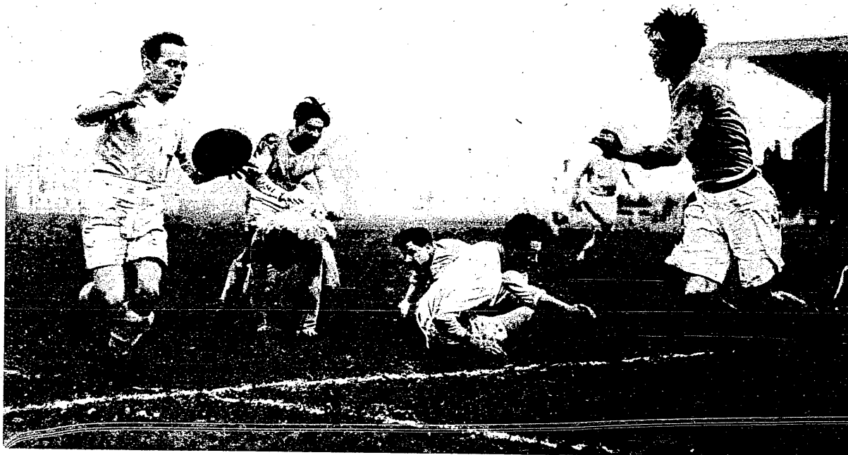
Moment z meczu rugby: Francja — Anglja.