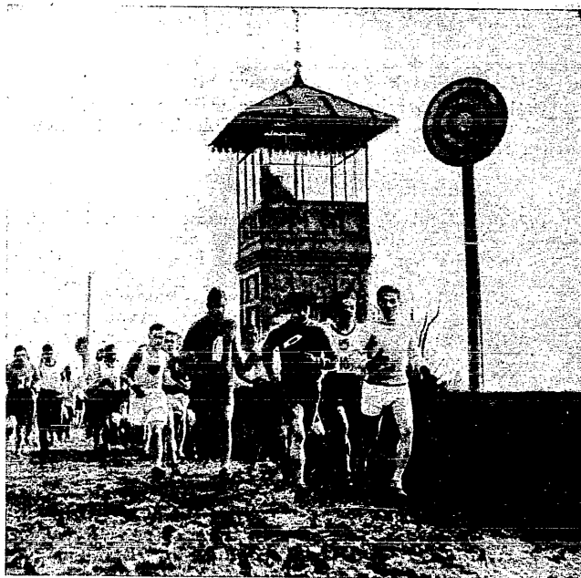
Malanowski i Forys prowadzili od startu do mety.