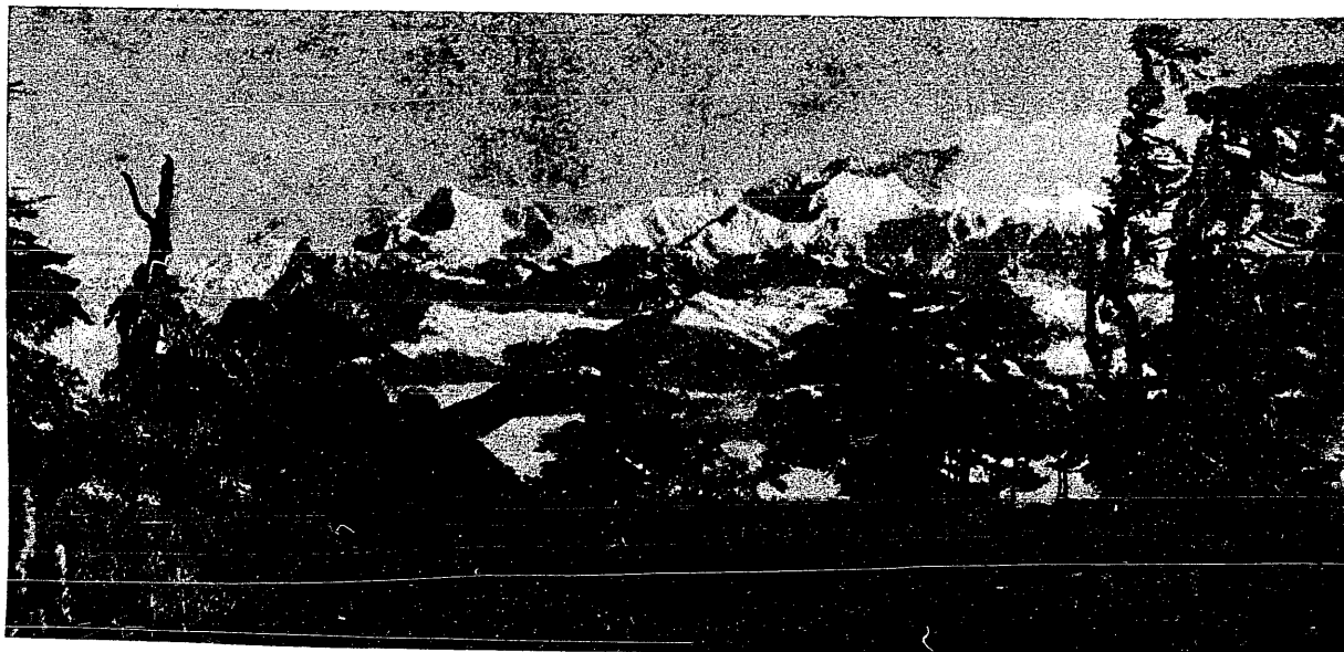
Grupa szczytów himalajskich bezpośrednio przytykająca do Mount Everest.