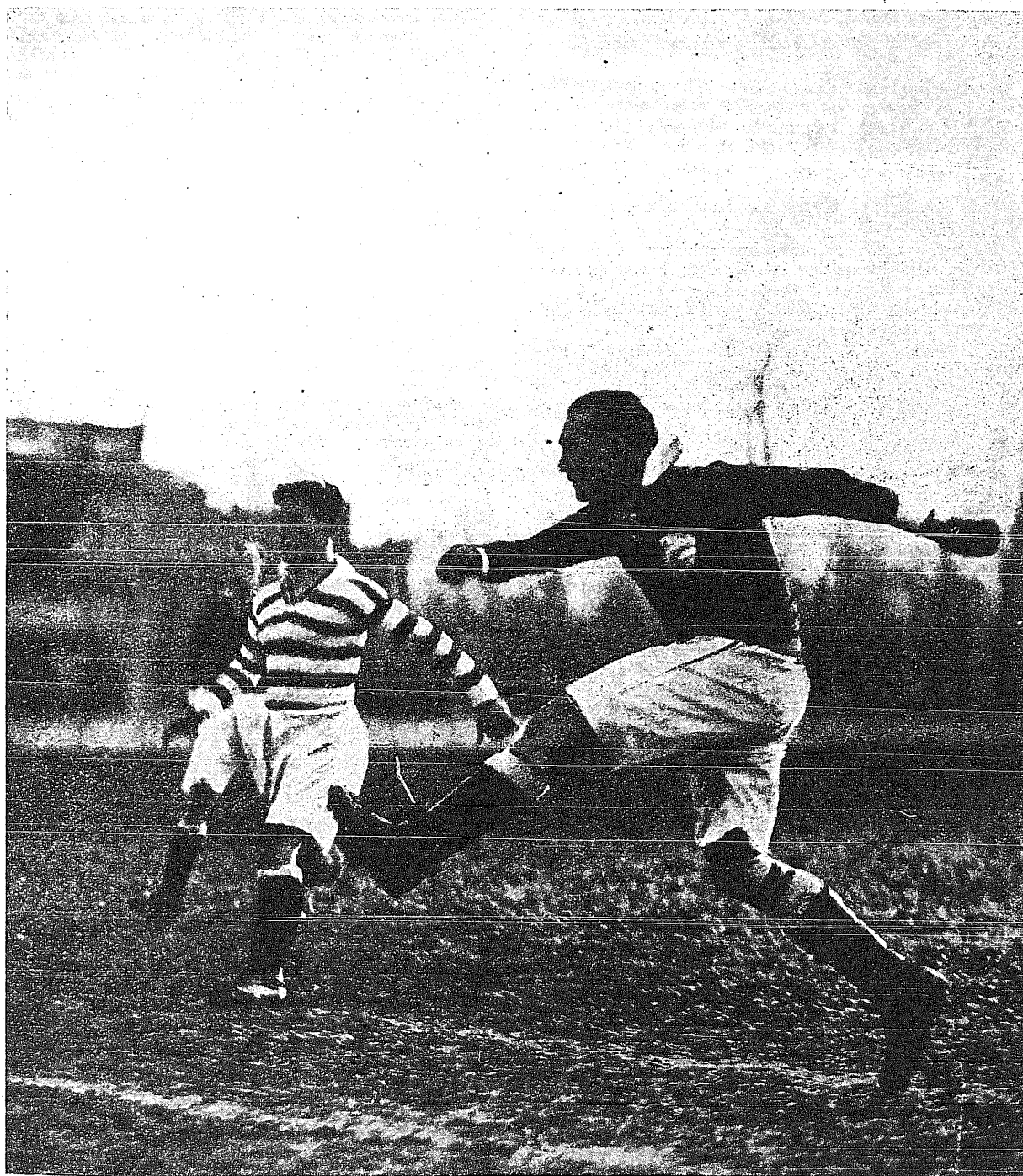
Pierwsze treningi piłkarskie w Warszawie.