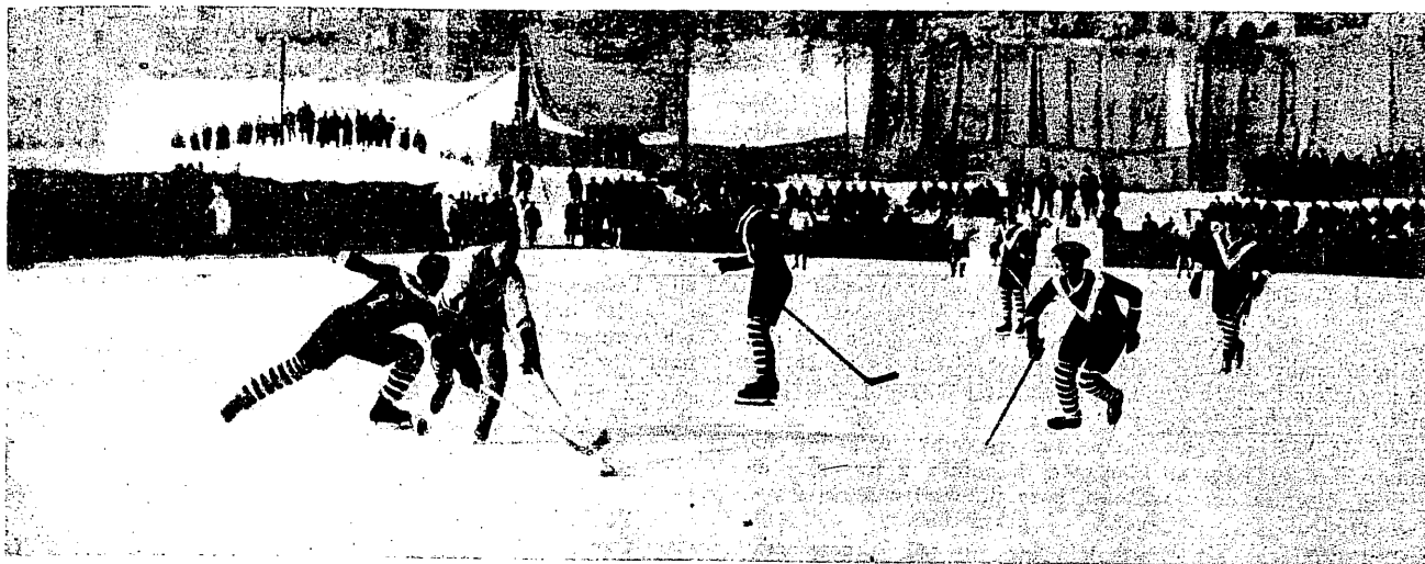
Hockeyowe mistrzostwa Europy w Davos. Z meczu Austria — Czechosłowacja 1 : 3.