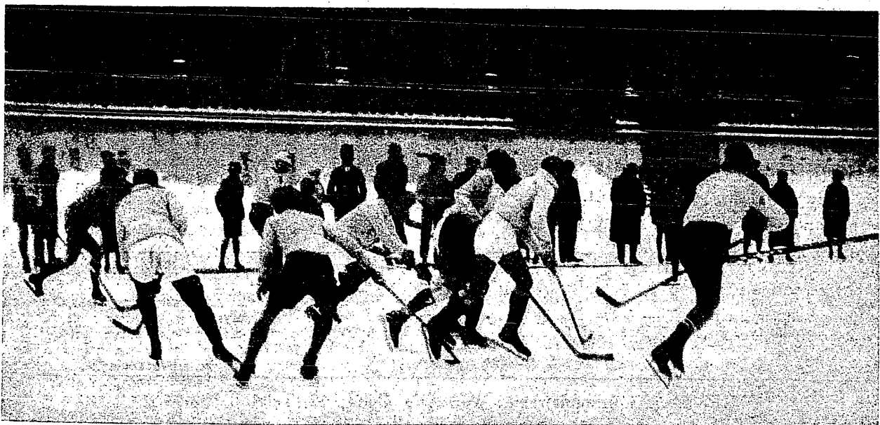
Moment z meczu Polonia — W. T. Ł. 5:1.

Artykułów nadesłanych bez specjalnego zamówienia i odrzuconych oraz odbitek zdjęć niezamieszczonych redakcja nie zwraca.