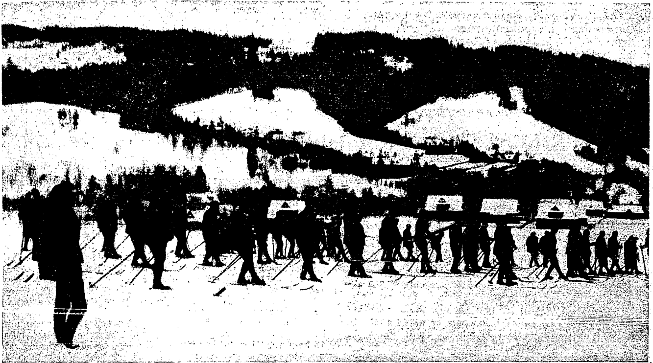
Z pierwszego związkowego kursu narciarskiego w Zakopanem.