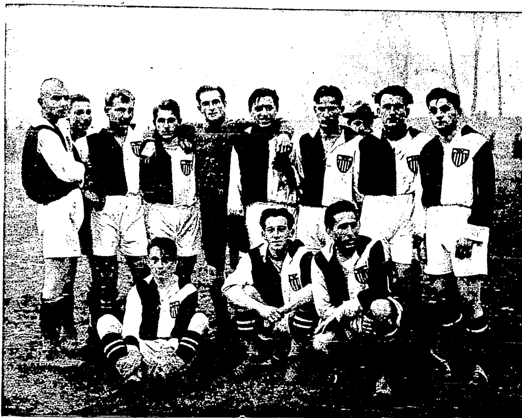
Drużyna piłkarska Warszawianki na boisku Skry.

czenia. Zapewne jeżeli zechcemy sprawę naszego udziału w ostatniej Olimpiadzie łączyć z organizacją ekspedycji, z tem, że jeden robił, drugi przeskadzał, a trzeci co najgorsze, wcale się sprawą nie interesował, jeżeli wreszcie zaczniemy ze smutkiem rozpatrywać wyniki naszych zawodników, to rzeczywiście niewiadomo, czy warto o tem mówić. A zresztą nikt nie ma do rozmowy ochoty, gdyż przecież Olimpiady i naszego w niej udziału wogóle nie dyskutowaliśmy. Pozostaje jednak jeszcze