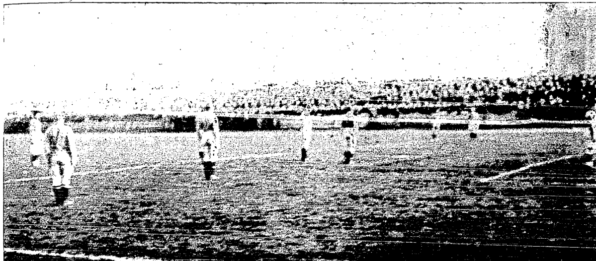
Z zawodów Szwecja—Polska w Krakowie.

Ujemnie zapisali się gracze Pogoni z racji gry brutalnej