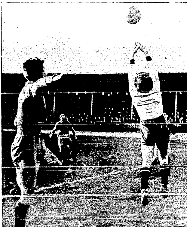
Z zawodów Szwecja—Polska w Krakowie.

Nie wyczerpujemy tu bynajmniej zakresu działania tej komisji. Z naszkicowanego zarysu widać, że czeka ją praca bardzo duża i to na czas dłuższy, poza referowaniem bowiem i działalnością praktyczną, wiele rzeczy będzie musiała wy-