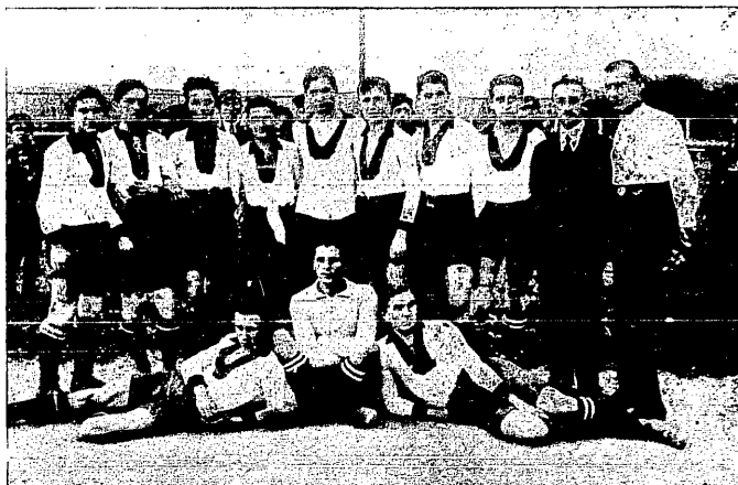
Drużyna piłkarska Gimnazjum II. w Przemyślu.

Przypadkowo spotkałem się w Wiedniu z wiceprezydentem jednego z czołowych pierwszoklasowych klubów wiedeńskich. Pan ten, krakowianin z pochodzenia, od lat osiadły w Wiedniu, zupełnie znaturalizowany w Wiedniu, informował się najpierw u mnie o stosunki sportowe w Polsce, a kiedy zapewniłem go, że u nas za grę się nie płaci, i że panują w sporcie takie same jak przed wojną stosunki, zrobił ogromnie zdziwioną minę i nie chciał wierzyć. „Bo u nas proszę Pana — opowiadał p. wiceprezydent — jest całkiem inaczej, ja właśnie przed chwilą kupiłem środkowego napastnika z II. kl. klubu za 20 milionów koron. Ale Panie co za towar! Niech Pan przyjdzie do nas na trening i oglądnie go przy robocie, to się Pan zdziwi, jak tanio kupiłem. Dobrze, że mam tam zastrzeżone prawo pierwokupu, bo gdyby tak