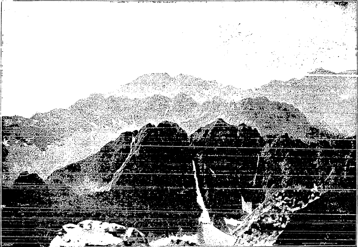
Widok z Lodowego ku zachodowi.

jedne po drugich „problemy“ taternickie, ulegają zdobyciu wszystkie szczyty i najtrudniejsze, za niemożliwe przedtem uznane ściany i granie Tatr. Sekcja Turystyczna, owo zrzeszenie kwiatu taterników polskich, owa atakowana przez niewtajemniczonych „kapliczka wybranych“ wydaje swój organ „Taternik“, głosząc w nim swe hasła i poglądy z całą siłą i impetem młodości. Odniósłszy wreszcie przebojem zwycięstwo, rozgłosiłszy sławę turystyki szeroko i poza granice kraju, pokonawszy opór starszych i zaskorupałych w swych przekonaniach czynników i zdobywszy T. T. dla swoich idei, Sekcja Turystyczna stanęła w ostatnich latach przed wojną u szczytu swego rozwoju i stworzyła „złoty wiek“, taternictwa polskiego. Wzniósłszy się na te wyżyny, rozciągnęła swą opiekę nad przewodnictwem polskim, sta-