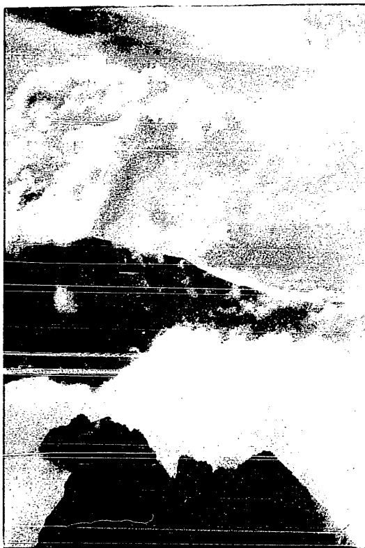
Z południowej strony Tatr: szczyt Łomnicy.