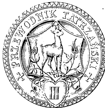
Oznaka przewodnika tatrzańskiego.

Na Bezdrożach Tatrzańskich — Marjusza Zaruskiego, jest zbiorkiem artykułów literackich, publikowanych w różnych czasopismach. Niezwykła trudność, jaką jest literackie ujęcie wycieczek wysokogórskich, ułatwia autorowi bogata w przeżycia przeszłość taternicka. To zezwala na dobór tematów, które, choćby ze względu na samą niezwykłość wydarzeń, muszą zainteresować nawet obytego z przygodami taternika. Zaś dla przeciętnego czytelnika opisy te będą prawdziwą sensacją, niemniej zdumiewającą od opisu wypraw do bieguna północnego. Swoisty p. Zaruskiemu ideowy podkład stosunku go gór, w których upatruje źródło tężyzny życiowej, hartu i siły, nadaje dziełku znaczenie społeczne.