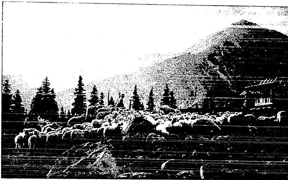
Z wędrowek po Tatrach: rano na Hali Gąsienicowej.

(Ze zbiorów Sekcji Turystycznej A. Z. S. Kraków)