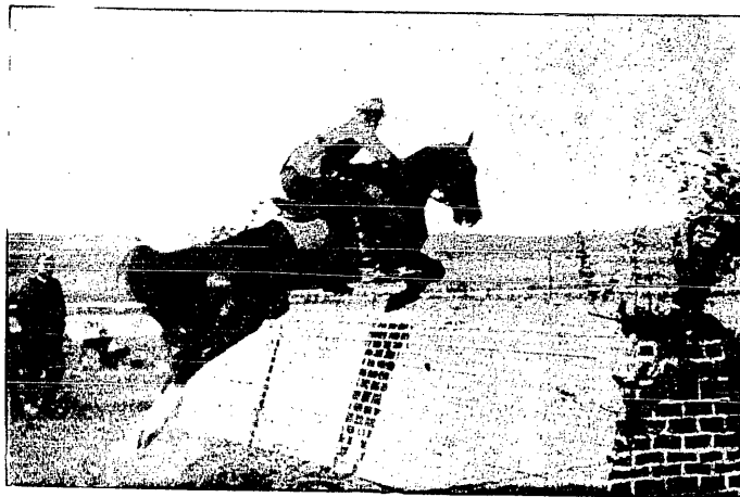
Z konkursów hippicznych w Kobierzynie.

Perska, środkowy napastnik Jugosłowian, nie zorientował się zaraz w systemie gry naszych obrońców, to też początkowo bardzo się dziwił, gdy gwizdek sędziego zastawał