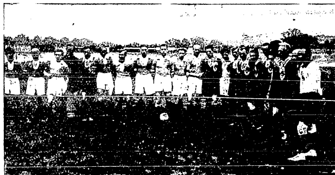
Z zawodów Kraków—Lwów (0:0) w Krakowie.

Mecz ten zadecydował, kto zajmie ostatnie miejsce w tut. klasie C. Przedostatnim prawdopodobnie będzie Dror, a o pierwsze miejsce dopiero rozstrzygnie się walka między Metałem i Bochnią.