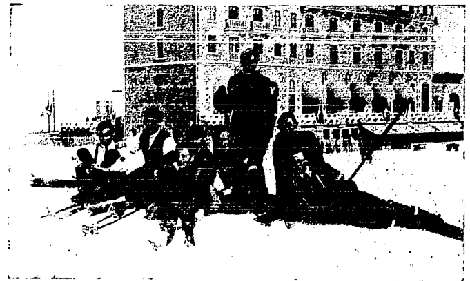
Zawody w Pirenejach. Grupa zawodników polskich; w głębi hotel w Luchon.

Ten sam zarzut dla niedostępności szerszych mas (ze względu na tor i przyrząd) przedstawia wioślarka. Jest to jednak jeden z najzdrowszych, najlepiej rozwijających, najpopularniejszych, dziś już klasycznych sportów. Wioślarka też zdaniem mojem najlepiejby się nadawała na piąty punkt pięcioboju. Powstaje teraz kwestja typu jednoosobowej. Mogą tu wchodzić w grę: skiff (fornirowy), scull (klepkowy), zwykła „hamburka” (spacerowa lub pół-wyścigowa) lub wreszcie kajak (canoë). Skiff jest łodzią zbyt drogą (w Polsce w roku 1922 było ich aż... sześć)