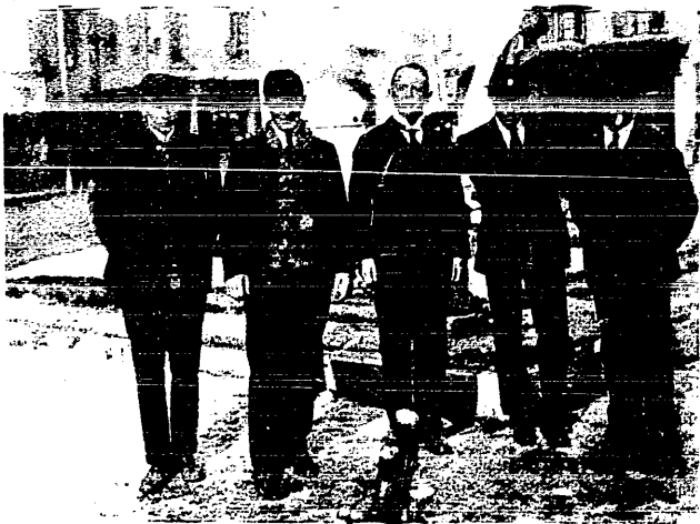
Zawody w Pirenejach. Grupa zawodników szwedzkich.

Jest absurdem, by miarą boksera miały być wyniki osiągnięte przez jego współzawodników w lekkiej atletyce i pływaniu. Znakomity bokser otrzyma więc mało punktów, jeżeli startuje z marnymi lekko-atletami i viceversa. Tu znów widzę przykład pokrzywdzenia boksu, który na takie postępowanie bynajmniej nie zasługuje. Wreszcie dla tych trudności i zamętu dołącza się sprawa nowa: różnica wagi, czynnik w boksie pierwszorzędno znaczenia.