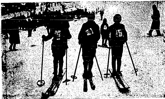
Zawody międzynarodowe. — Zwycięzcy biegu dzieci.