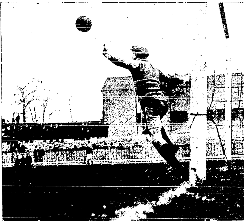
Z zawodów Cracovia—Servette w Paryżu.

w całej jedenastce nieprzychylny nastrój masy musi działać deprymująco i krępować swobodę jej ruchów. Najgorzej jest zagranicą, bo tam stanąć trzeba do walki z drużyną i z publicznością obcą nietylko wskutek sympatii do miejscowego przeciwnika, lecz obcą także pod względem narodowościowym. Tam trzeba składać próbę nietylko swej umiejętności technicznej, lecz gorszą jeszcze próbę — nerwów. Jeśli nerwy, silna wola odmówią posłuszeństwa — wtedy na nic się zda wyszkolenie, wprawa, sprawność fizyczna. Próbę nerwową wytrzymują tylko albo gracze zupełnie zimnokrwisci, niewrażliwi na nic, a takich jest znikoma ilość, szczególnie u nas, gdzie piłkę nożną uprawia jeszcze przeważnie inteligencja, młodzież szkolna, z natury rzeczy wrażliwa na podniety psychiczne — albo drużyna złożona ze starych „wygów“, którzy niejedną taką próbę ogniową mają za sobą; tę zaś zdobywa się najprędzej, gdy się gra na obczyźnie, w różnych krajach, bo w każdym z nich publiczność zachowuje się inaczej, w mniejszym lub większym stopniu wpływa na tok gry, ale wszędzie jest nieprzychylna drużynie obcej. Z tego powodu miano prawdziwie pierwszoklasowej drużyny zdobywa sobie tylko ta drużyna, która wszędzie potrafi zachować zimną