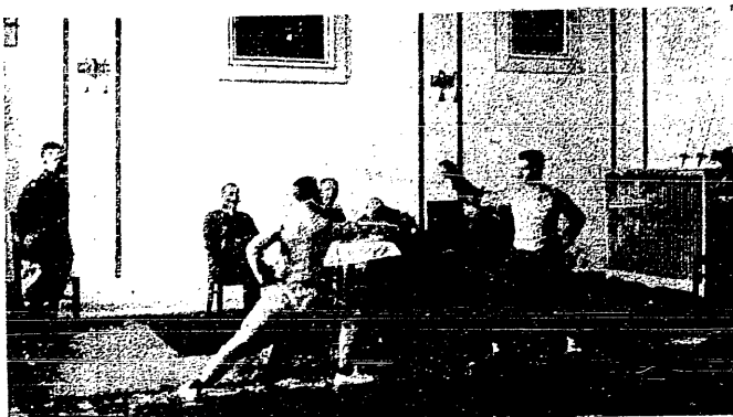
Szermierka w armji. Turniej D. O. K. Toruń.

Następnie przystąpiono do obrad nad wnioskiem Polonii przeciw lidze, a za utrzymaniem dotychczasowego systemu rozgrywek w klasie A. mimo, że wnioski Pogoni—Czarnych na wprowadzenie ligi, względnie p. Szargla na zmiany w dot.