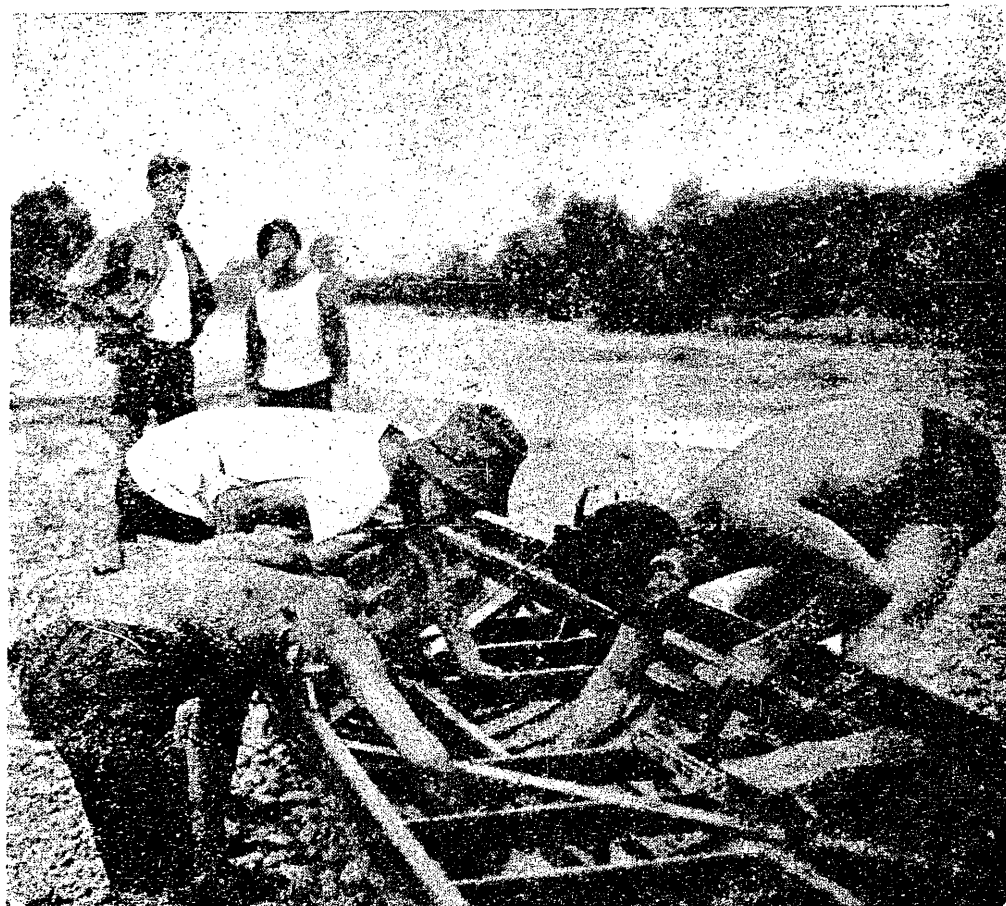
Łodzią z Krakowa do Oświęcimia. Naprawa łodzi.

Dotychczas niebywała, nadzwyczajna ekspedycja! Trzydniowa, pełna trudności wycieczka! Sześciwiosłowa do Oświęcimia! Poszukuje się ośmiu warjatów, którzyby się odważyli na tego rodzaju nonsens.