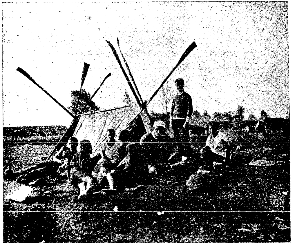
Łodzią z Krakowa do Oświęcimia. Wieczera.

A przecież dla drużyn klasy B, uczestniczących w rozgrywkach, był wynik spotkań niemniej ważny, jak dla drużyn klasy A, bo każda z nich włożyła ogromną dozę wysiłków, trudów, zaparcia się, by naprzód w mistrzostwach okręgowych wziąć górę nad licznymi rywalami lokalnymi, a następnie w walkach z mistrzami innych okręgów wyjść z jak największym honorem. Obojętność zatem, jaka tym rozgrywkom towarzyszyła, jest wielce niesłuszną i krzywdzącą.