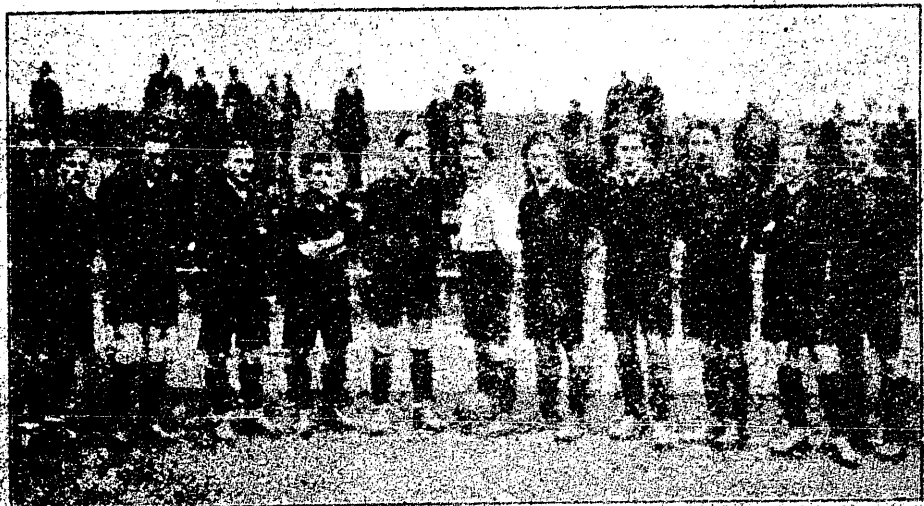
Der polnische Meister F.C. Czarni.

Tygodnik sportowy „Der Kicker“, wychodzący w Stuttgarcie, przynosi w numerze 46 reprodukcję fotografii lwowskich „Czarnych“ z podpisem „Der polnische Meister F. C. Czarni“. Źródło i cel tego oszukaństwa sportowego każdemu, kto bodaj powierzchownie orientuje się w stosunkach sportowych, muszą być całkiem jasne. Fotografia pochodzi z czasu niedawnego pobytu Czarnych w Czechach. Czechom chodziło z jednej strony o reklamę dla celów finansowych, z drugiej strony o pewny tryumf nad rzekomą mistrzowską drużyną Polski.