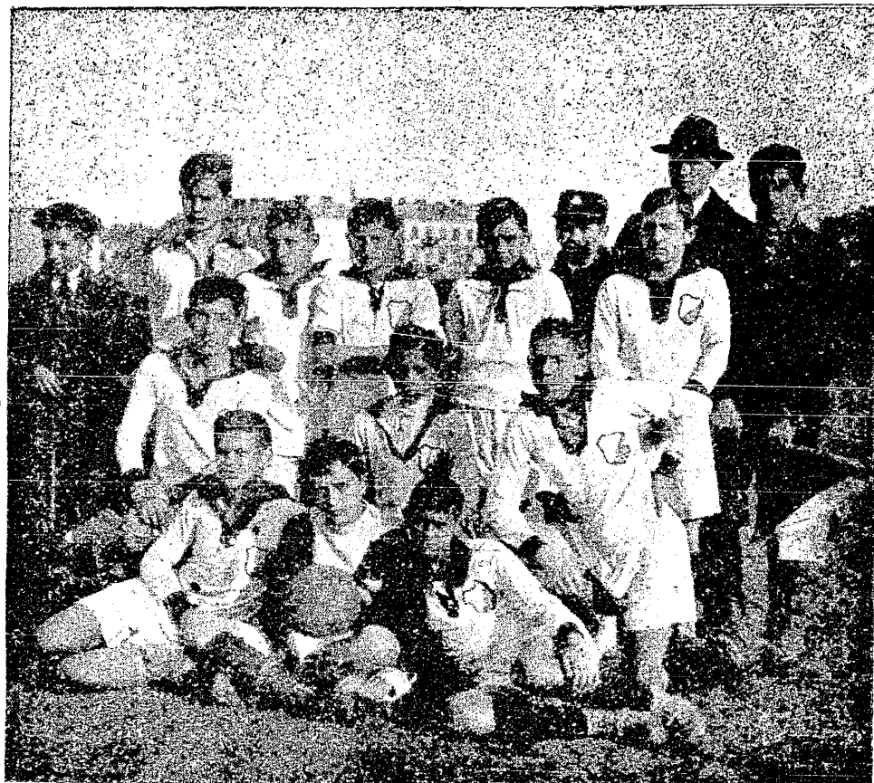
Druga drużyna juniorów K. S. Polonia w Warszawie.

Otóż zaraz na początku obudzenia się ruchu narodowego na Górnym Śląsku, rozwija się tam życie sportowe nadzwyczaj intensywnie. Prócz klubów, istniejących już za czasów niemieckich, powstaje jeszcze cały szereg nowych towarzystw sportowych, nacechowanych szczerym patriotyzmem, służących nietylko idei sportowej, lecz także idei połączenia Śląska z Macierzą. Pracują one z całym zapałem, na jaki ich tylko stać było, zwalczając nieprzeliczone przeszkody, z jedną myślą przewodnią: ciągle naprzód. Do pracy tej garną się przede wszystkim robotnicy polscy, żywił może najbardziej oddany sprawie polskiej. Zapisują się oni do polskich klubów sportowych całymi masami, widząc w nich ostoję polskości i niejako łącznik z ojczyzną. Ruch ten miał i przyczyny polityczne, dążył bowiem do obrony polskich ideałów przed stugłową hydrą pruską, która