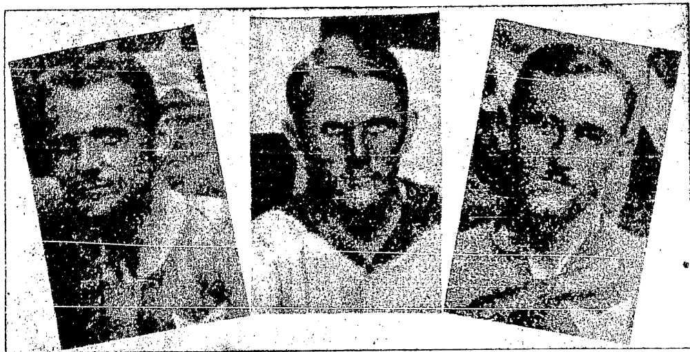
Trzej jubilaci Wisły.

Naturalnie, że przy tworzeniu tego Związku nie powinno się popełniać takich błędów kardynalnych, jak to miało miejsce przy utworzeniu P. K. I. O. Wtedy bowiem będzie on znowu instytucją poronioną bez wszelkiego autorytetu no i przyszłości. Dewizą niejako przy jego organizowaniu się musi być: jak najmniej ludzi uprzywilejowanych, jak najwięcej ludzi pracy. Podłoże zupełnie neutralne, wolne od wszelkich wpływów bądź to poszczególnych związków, bądź też klubów. Do Związku tego powołać się powinno jak najwięcej ludzi, stojących poza klubami, znających się jednakowoż na wszystkich brakach naszego sportu i rozumiejących doskonale jego zadania. Z poglądem niektórych panów, że ludzi takich dzisiaj niema, że stworzy ich dopiero przyszłość, zgodzić się nie mogę, albowiem jest dzisiaj bardzo wiele sportowców, którzy znajdują się w cieniu, stając się tylko biernymi widzami tej akcji, jaka się przed ich oczyma rozgrywa. Wielu z nich posiada bardzo wiele energii i niezaprzeczonych zdolności, niestety brak im stosunków. To wywołuje ich bezczynność z wielką szkodą dla samego sportu. Związek Związków składać się powinien z ludzi, rozumiejących swoje zadania i umiejących godnie bronić interesów ogólnosportowych. Nie znaczy to jednak, ażeby od pracy w nim usunięci zostali wszyscy dotychczasowi liderzy sportowi. I dla nich miejsca nie zabraknie. Muszą się oni jednak wyrzucić niektórych swych wad, w szczególności sejmikowania bez pozytywnych