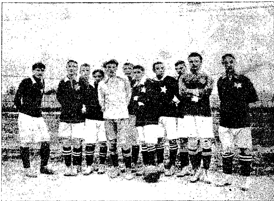
Drużyna Wisły z r. 1911.

W tym składzie Wisła na I. igrzyskach sportowych we Lwowie zdobyła mistrzostwo bijąc Czarnych 3:1.