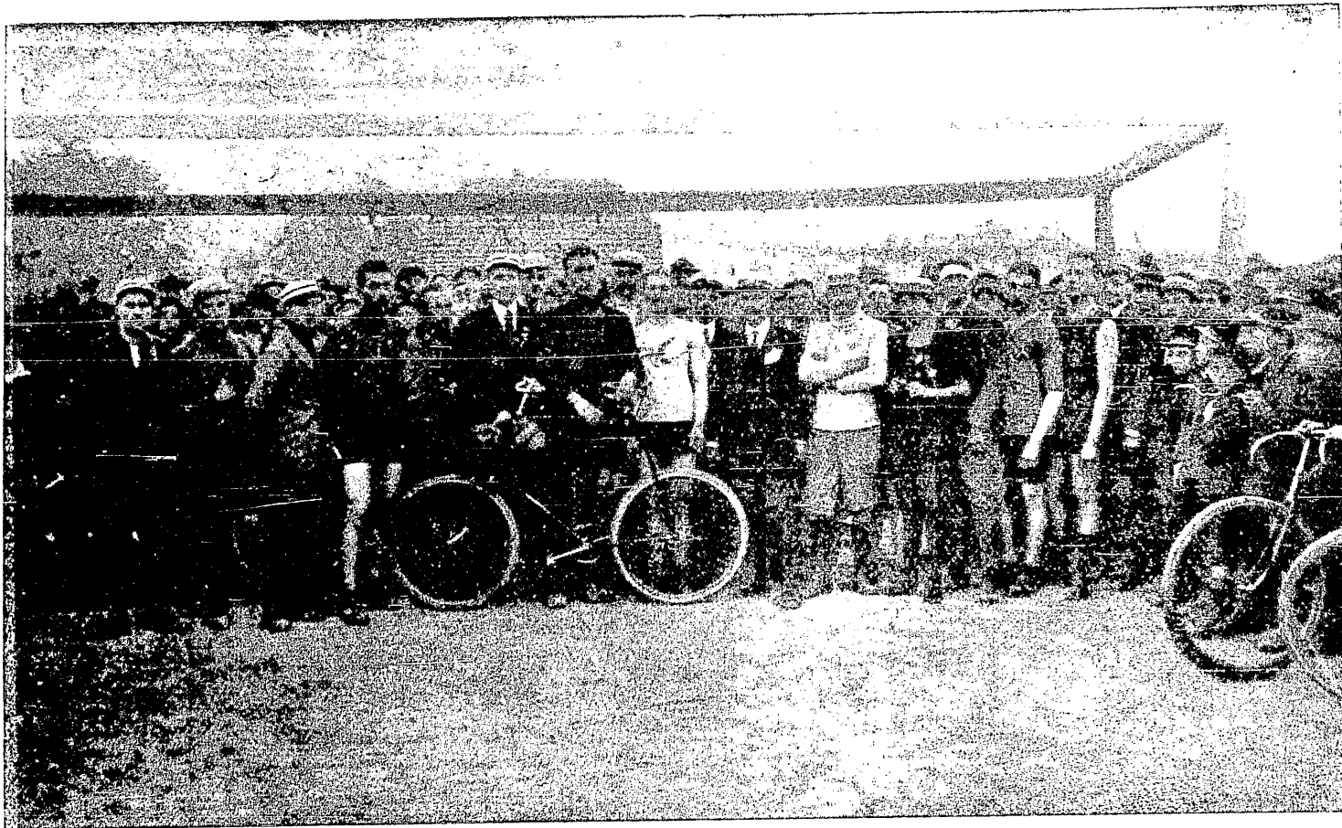
Uczestnicy wyścigów cyklistów w Krakowie.