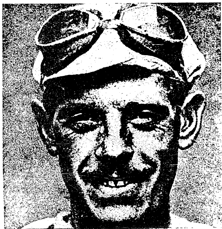
Léon Scieur, zwycięzca biegu Tour de France (5485 km. w czasie 221 godz. 50 min. 26 sek.) po przybyciu do celu.

oczy „pięciobój“ (pentathlon) najtęższej młodzi greckiej, tę walkę o uzyskanie tak skromnej, a jednak tak pożądanej nagrody: wieńca wawrzynowego. Wszędzie, gdzie rozbrzmiewała grecka mowa, imię zwycięzcy było na ustach wszystkich: poeci — zwłaszcza Pindar — w natchnionych odach sławili tych najdzielniejszych z dzielnych, a miasto, w którym taki młodzian ujrzał światło dzienne, przyjmowało go jak tryumfatora, nadawało mu obywatelstwo honorowe i utrzymywało go do końca życia swoim kosztem. Tak Grecja starożytna uprawiała kult piękna, zwinności, siły i harmonji cielesnej!