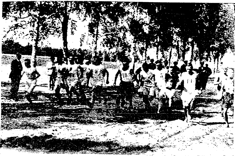
Bieg leśny S. S. Unionu w Łodzi.

drugiego miejsca w mistrzostwie jest więcej niż problematyczne. Warta i Polonia wyprzedziły Pogon o 2 punkty, mając o 1 match mniej od niej. Najbliższa niedziela przynosi dwie ostatnie rozgrywki pierwszej serji. Cracovia wyjeżdża po raz pierwszy od czasu swego istnienia do Wielkopolski, by się spotkać z Wartą. Drużyna poznańska zwróciła powszechną uwagę swym zwycięstwem nad Pogonią, dzięki czemu już od 2 tygodni (obecnie pokonała Ł. K. S.) utrzymuje się na 2 miejscu. Jest to drużyna słaba technicznie i taktycznie, lecz posiada jedną wielką zaletę, która często więcej znaczy, niż najlepsze wyszkolenie: szaloną ambicję i ofiarność oraz silną wolę zwycięstwa. Dlatego Cracovia będzie miała twarde orzech do zgryzienia; większa rutyna i wyrobienie techniczne pozwolą jednak Cracovii — jak się spodziewamy — pokonać swego twardego przeciwnika i utrwalić swą pozycję w mistrzostwie.