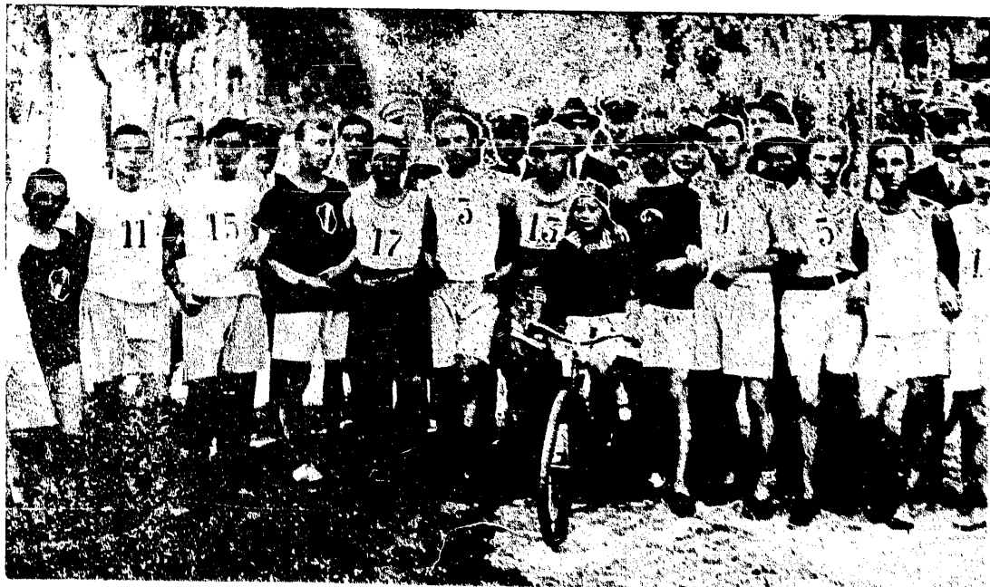
Uczestnicy biegu leśnego S. S. Unionu w Łodzi.