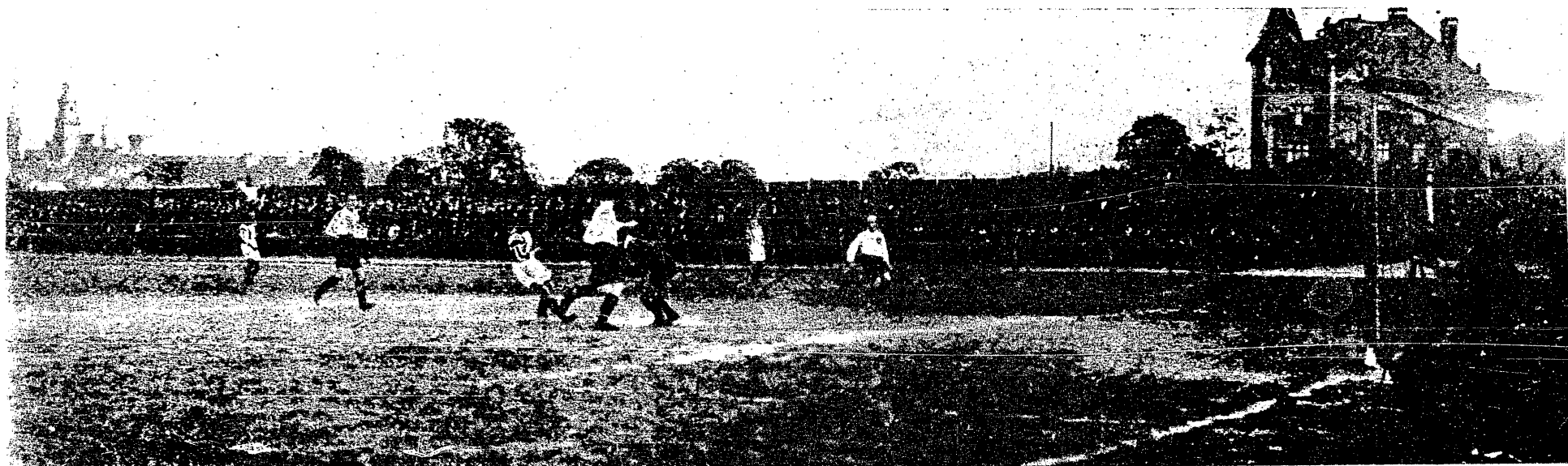
Z zawodów Cracovia—B. B. S. V. Pod bramką B. B. S. V.