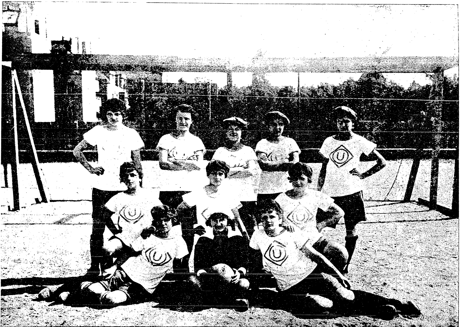
T. S. „Unia“ (Poznań). Pierwsza żeńska drużyna footballowa w Polsce.

ESHAPE SPÓŁKA HANDLOWO-PRZEMYSŁOWA KAPITAŁ ZAKŁADOWY 5,000.000 MAREK