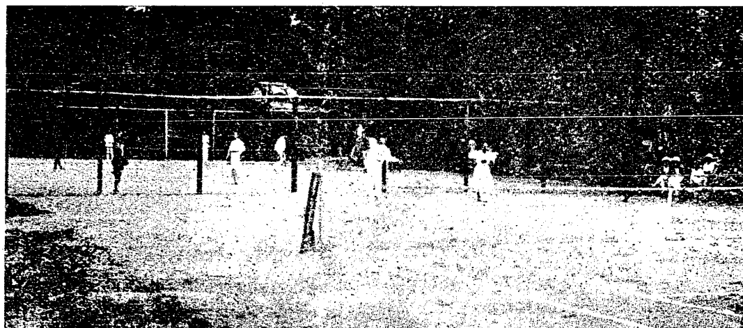
Z turnieju tenisowego A. Z. S. w Krakowie.