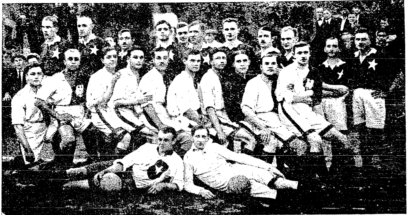
T. S. Wisła (Kraków) i K. S. Polonia (Czerniowce).

Na zaproszenie klubów „Jahn“ i „Polonia“ wyruszyła dnia 1-go b. m. krakowska „Wisła“ do Czerniowiec, gdzie w czasie dziewięciodniowego pobytu rozegrała z tamtejszemi klubami sześć matchów, wychodząc z każdego zwycięsko. Z pośród drużyn tych wyróżnia się „Polonia“, mistrzowska drużyna Rumunji. Podnieść na-