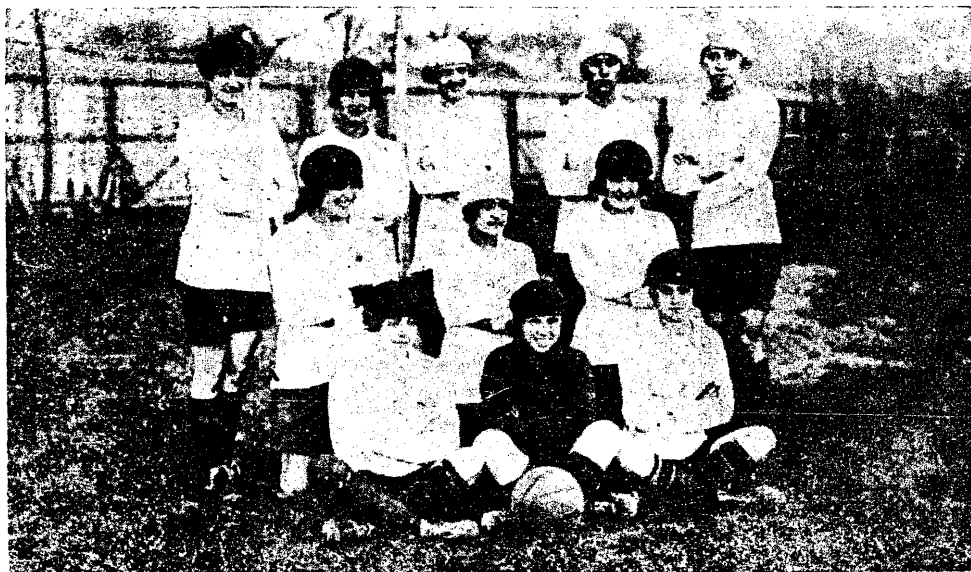
Reprezentatywna drużyna kobieca Francji która grała z angielską drużyną kobiecą z wynikiem 1:1.