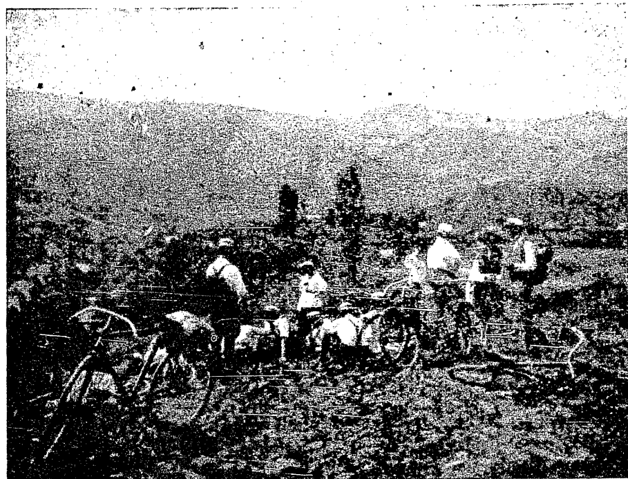
Z wycieczki K. K. C. M.

Nurmi , fenomenalny lekkoatleta finlandzki, postawił na meetingu w Helsingforsie nowy rekord światowy , przebiegłszy 2000 m. w czasie 5:28·8, bijąc dotychczasowy rekord Szweda Zandera (czas 5:30·4).