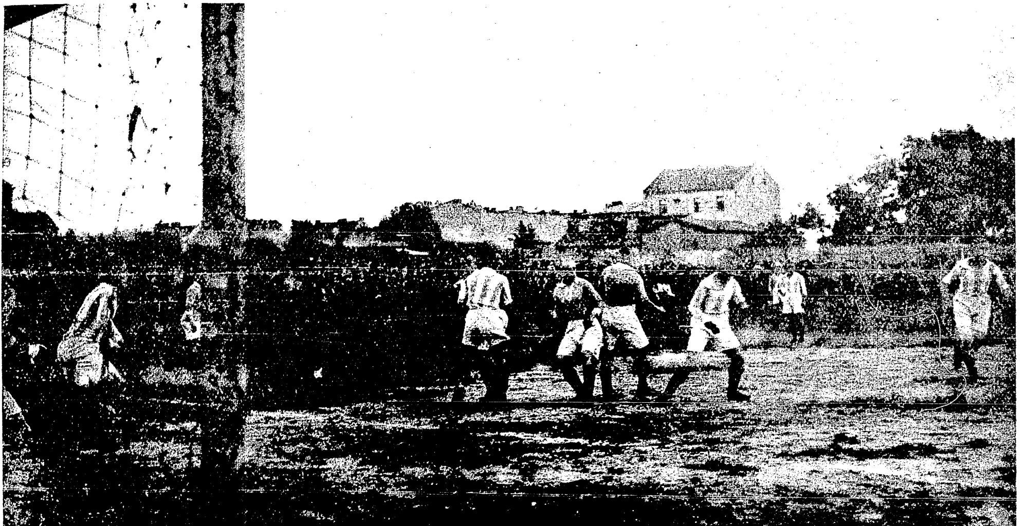
Moment z zawodów Ujpesti T. E. z komb. drużyną Cracovii, Wisły i Makkabi.

ESHAPE SPÓŁKA HANDLOWO-PRZEMYSŁOWA KAPITAŁ ZAKŁADOWY 5,000.000 MAREK