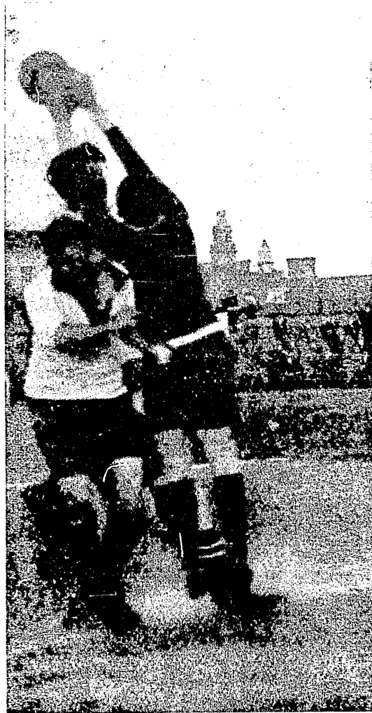
Z matchu Jutrzenka—Sturm. Bramkarz Sturm w opresji.

Drugiego dnia match odrazu w tempie ostrem. Czarni dzzisie si to nie ci z soboty. Węgrzy nie mogą przyjąć