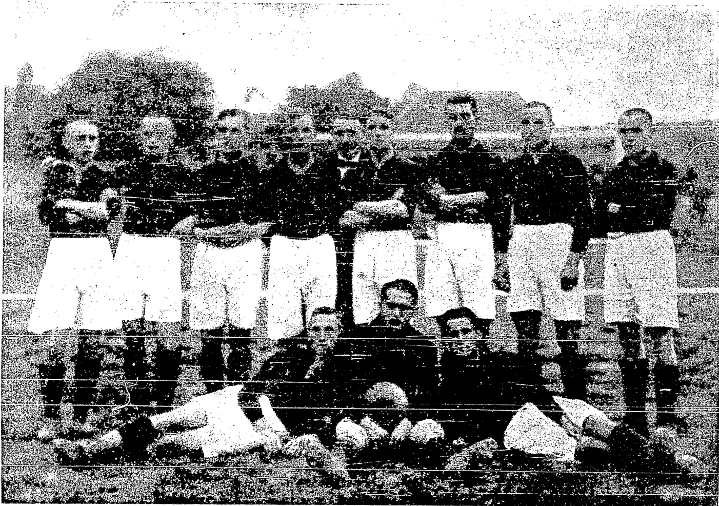
Kispesti A. C. (Budapeszt)

Z zawodów okręgowych wychodziliśmy zadowoleni i — niezdenerwowani.