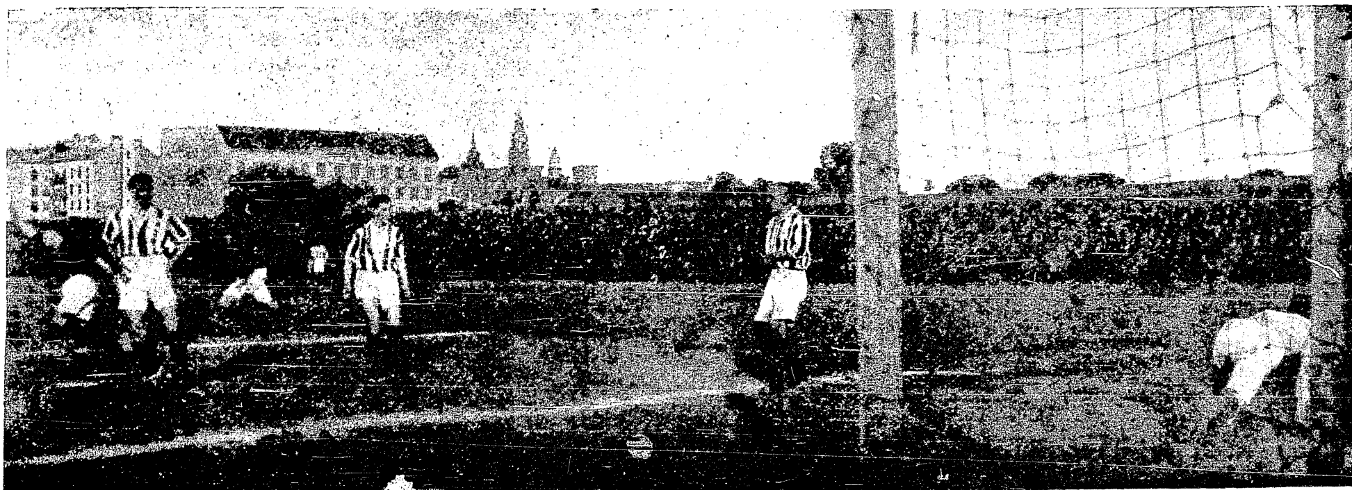
Moment z drugiego matchu Kispesti A. C.—Cracovia: Węgrzy zdobywają pierwszą bramkę.