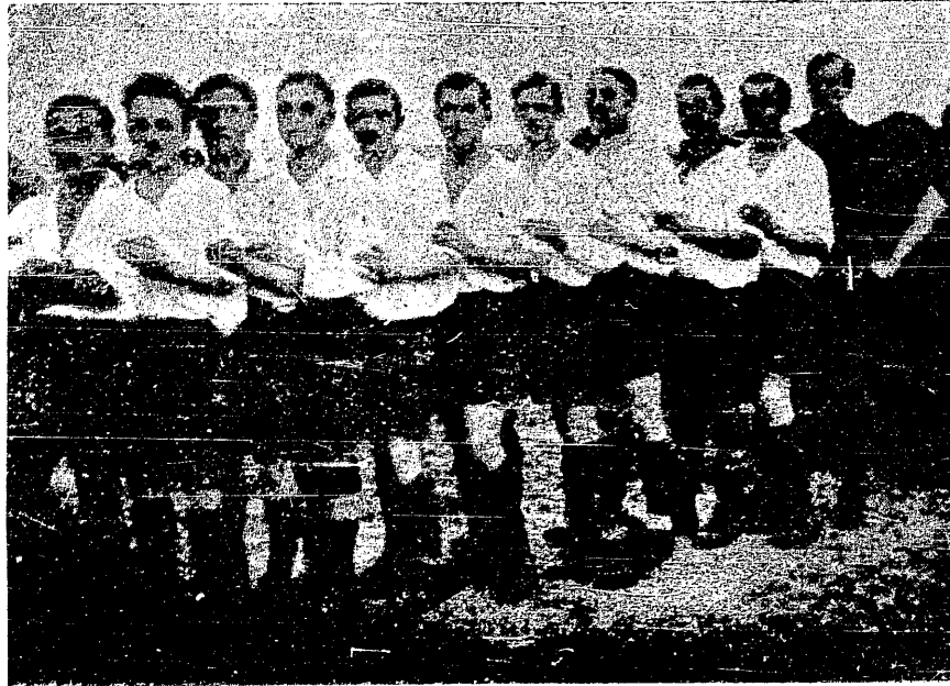
K. S. „Polonia“, Przemyśl.

Powyższe zalety gry w piłkę nożną, połączone ponadto ze szlachetnym współzawodnictwem bez wzajemnej nienawiści, zapewniające zwycięstwo drużynie nie tylko więcej wyćwiczonej i wyszkolonej, lecz przede wszystkim owianej duchem jedności, zbratania i współpracy w dążeniu do jednego celu wspólnymi siłami, wyjaśniają nam to „zawisko, dlaczego sport ten jest tak popularnym, tak powszechnym i podbijającym wszystkie warstwy społeczne i narody. Szerokie masy powinny zrozumieć piękno tej wspólnej walki, popierać ten sport